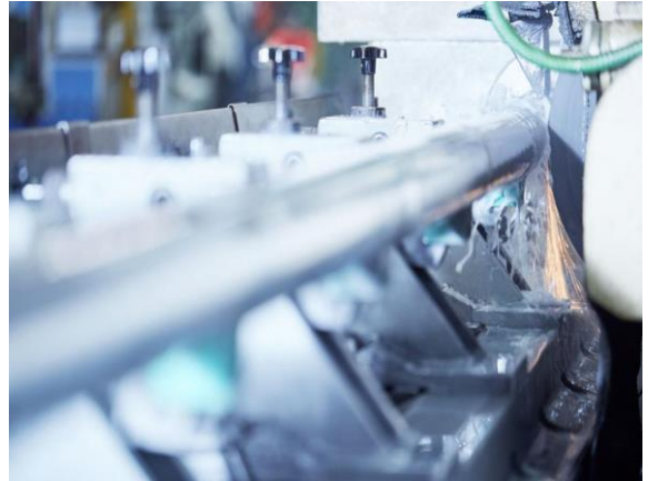
Drehen | Schweißen | Montieren | Kontrollieren