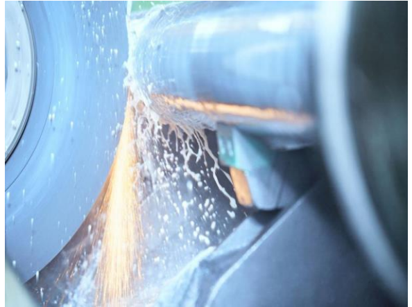
Vom Entwurf in die Fertigstellung

Sonderausführungen oder grössere Dimension werden selbstverständlich auch angeboten